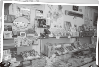
伊賀上野名産協同組合 直売所

伊賀市上野東町商店街振興組合、伊賀上野銀座商店街振興組合、伊賀上野名産協同組合を訪問し、伊賀忍者を活用した地域活性化の取り組みについてお話を伺いました。