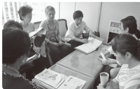
▲物産委員会の模様

現在は、物産委員会等5つの委員会を設けてご来場いただく皆様へのおもてなし等について検討中です。