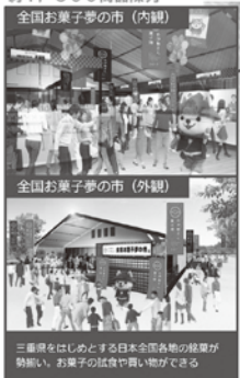
全国お菓子夢の市(内観)