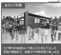
江戸時代の街道口いで商人たちをもてなした茶店の雰囲気で、和菓子や伊勢茶等が楽しめる