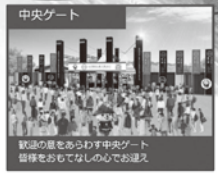
秋の産物あふれる中央ゲート 皆様をおもてなしの心でお迎え