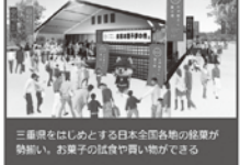
三重県をはじめとする日本全国各地の産物が勢揃い。お菓子の試食や買い物ができる