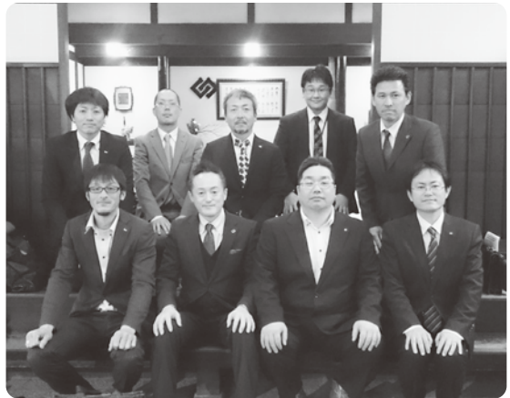
村田会長(前列左から2人目)

「各組織が手を取り合って助けあうための方法を考えたい」「青年4団体と県との結びつきを強くしたい」といった意見があり、意見交換会の後には、親睦会が開催され、各々交流を深めました。