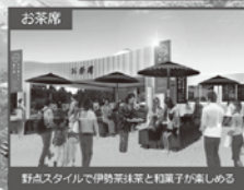
野点スタイルで伊勢茶味家と和菓子が楽しめる