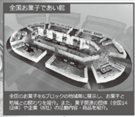
全国お菓子であい館