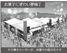
お菓子にぎわい夢構丁

江崎グリコ・カルビー・不二家・ブルボン・明治・森永製菓・山崎製パン・ロッテの計8社 お菓子の無料配布やイベントを毎日実施!